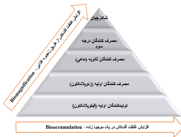
شکل (۲) تجمع زیستی و بزرگ‌سازی زیستی (اصلی)

آفت‌کش‌ها با توجه به قابلیت انحلال در توده‌های زیستی، پایدارند و تجمع آن‌ها سبب تغییرات رادیکال‌های فعال اکسیژن می‌شود که استرس اکسیداتیو و مرگ سلولی را در پی دارد (شفیق و همکاران، ۲۰۲۰). به‌دلیل تجمع زیستی مواد سمی در بافت‌ها و اندام‌های مختلف، گاهی غلظت آفت‌کش‌ها در موجودات آبرزی چندین برابر بیشتر از اکوسیستم است (کائور و جیندال ۸ ، ۲۰۱۷). برخی از سموم در بدن آبرزیان ذخیره می‌شوند و بیش از آنچه در طبیعت موجود است، تغلیظ می‌شوند و در نهایت به زنجیره‌ی غذایی وارد می‌شوند. تغلیظ زیستی ۹ نتیجه توأم جذب و دفع مواد شیمیایی از محیط اطراف است و میزان آن به عوامل مختلف فیزیوشیمیایی آفت‌کش بستگی دارد (ری و شاجو و همکاران، ۲۰۲۳).